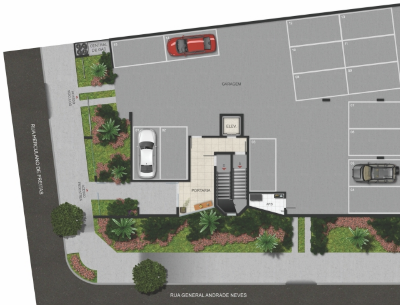
EDIFÍCIO GUTIERREZ | GARAGEM 1º PAVIMENTO