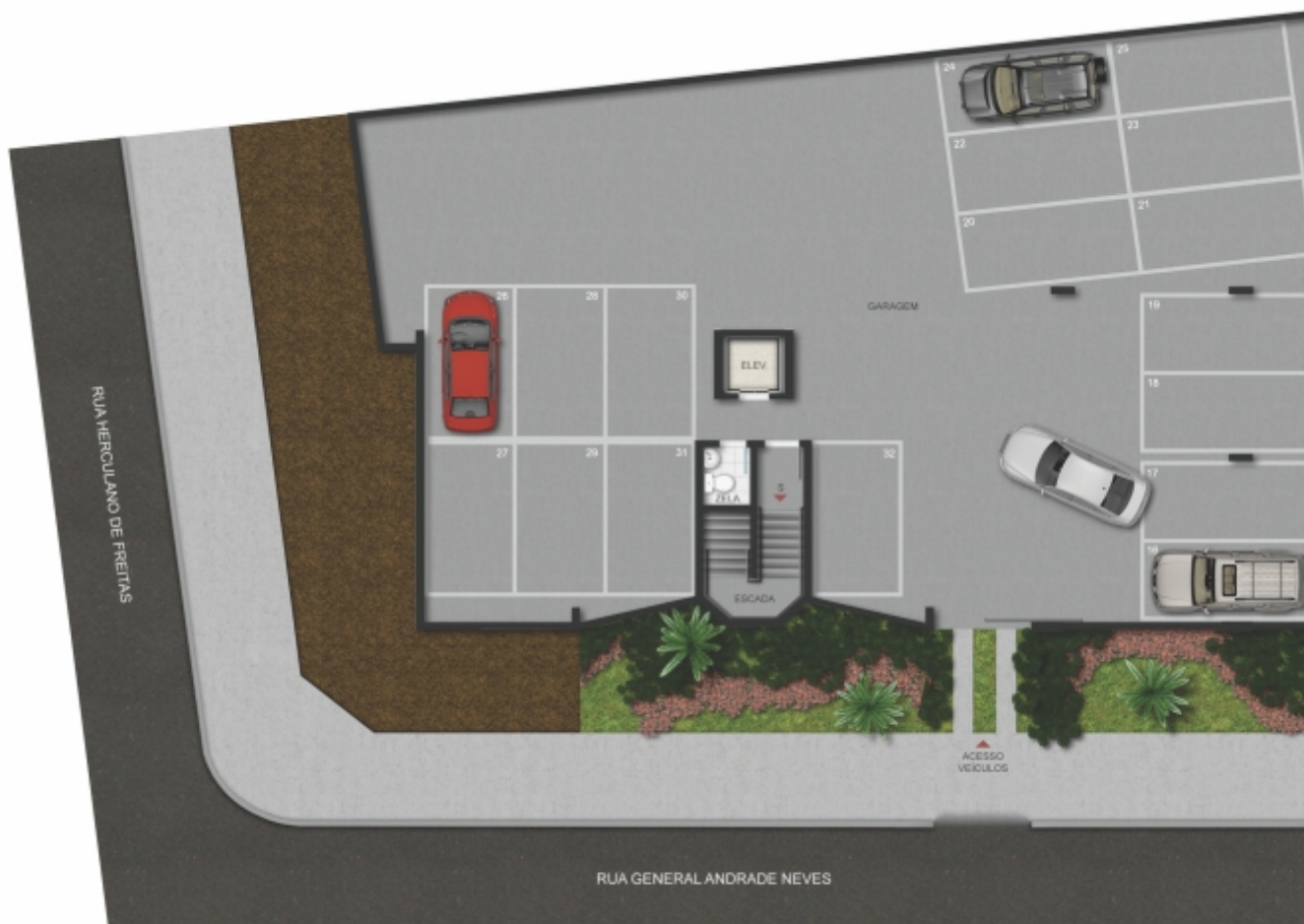
EDIFÍCIO GUTIEREZ | GARAGEM 1º SUBSOLO